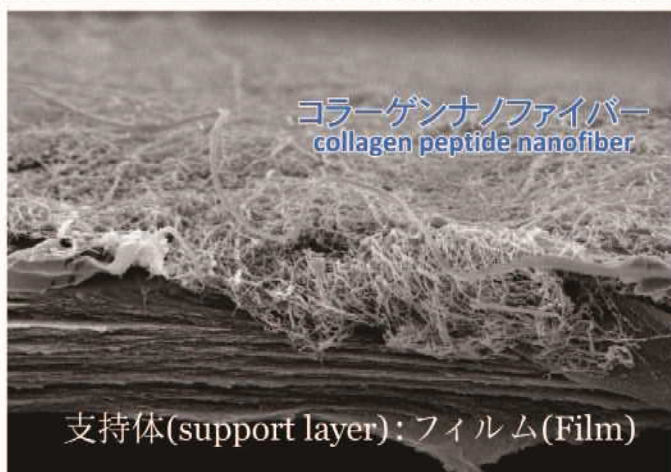
断面写真 Cross-section view